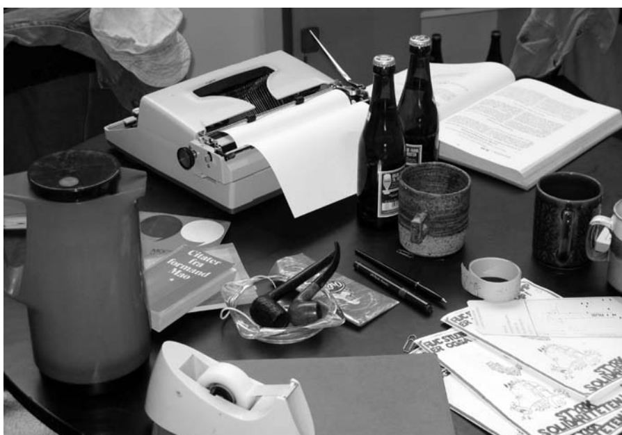
Piberygning og formand Mao. Et absolut must på RUC i 70'erne

"Åh, min kære gamle ven – Roskilde Universitets Bibliotek". Den futuristiske bygning tårner sig atter op over skriverkarlen, og bogstaverne der dvæler i dens indre luller mig ind i en dejlig komfortabel tilstand. Afstressende. De kalder mig indenfor, og når nu mit bestemmelsessted alligevel er i kolossens bug, så lader jeg mig blindt føre af sted. Døren er stadig for smal, men duften af de herlige bøger får mig til at slå det hen. Det er ikke derfor, jeg er her. Det er i stedet for at få rusket op i en følelse jeg ikke har mærket længe. Nemlig den helt særlige følelse man får på et museum, eller andre steder der giver de runde kinder et kys af historie. Blandingen af fascination for den anden verden man synes at stirre ind i, mikset med lettelsen over ikke være tvunget til at leve i den verden. Tollundmanden og Solvognen bringer vores tanker tilbage til