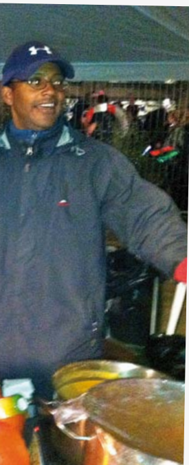
...ke til hotdog i pølsevognen, er suppebod.