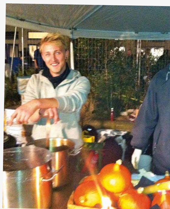
Madmulighederne er altid mange til den årlige fest. Er man ikke der samme niveau af salgstalent og humør i den sunde græskar...