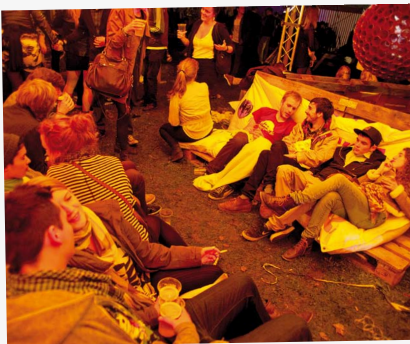
I RUC's Lounge var der dømt chill i bløde hjemmelavede sofaer til tonerne fra de mange bands i Mayateltet overfor. Det runde telt med de kulørte lamper indbød til en afslappende stund, inden festen fortsatte til andre telte på den våde mark.