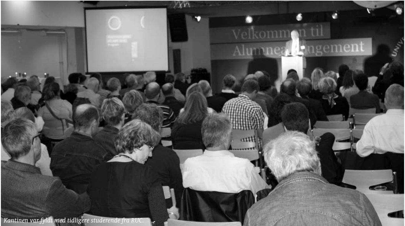
Kantinen var fyldt med tidligere studerende fra RUC.