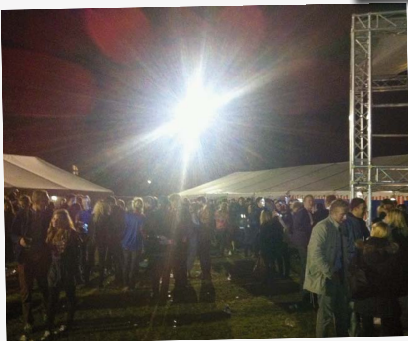
Også udenfor, mellem de mange telte, var der høj stemning, på trods af den silende regn.