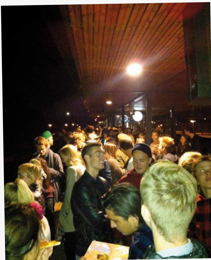
Glade gæster spiller på sidste vers på stationen, hvor de, som altid, venter som sild i en tønde på det sidste tog fra endnu en årsfest på RUC.

Temafesten fortsatte til den ellers formelle kantine, hvor teknologien havde sejret over mennesket, og poledancers i pink stod klar i menneskemængden.