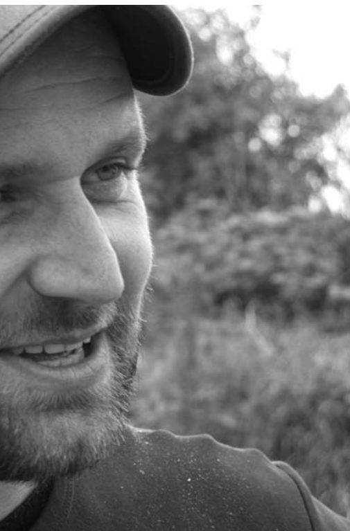
RUC siden marts 2011. Bor i Tureby, er gift og har to børn