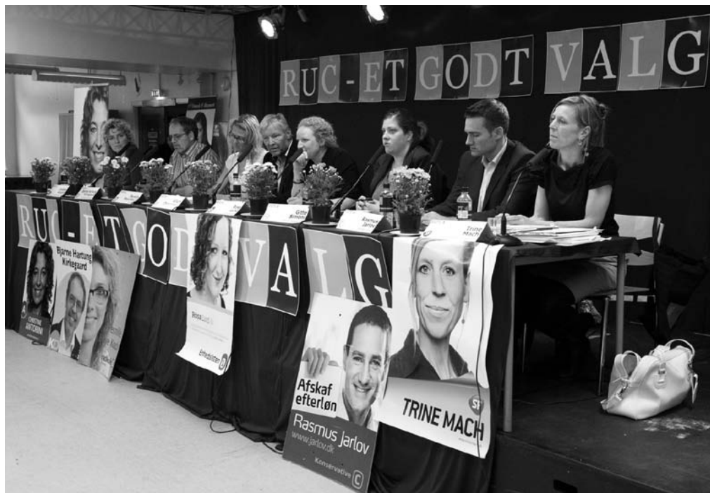
Paneldeltagere i debatten: (Fra venstre) Christine Antorini (S), Bjarne Hartung Kirkegaard (KD), Pernille Boye Koch (R), Willum Christensen (LA), Rosa Lund (Ø), Gitte Simoni (DF), Rasmus Jarlov (K), Trine Mach (SF).