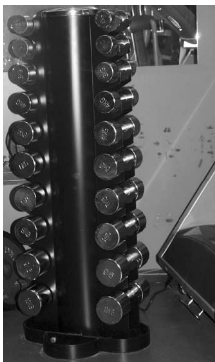
Motionslokalet har det hele - håndvægte, romaskiner og afslappet stemning.