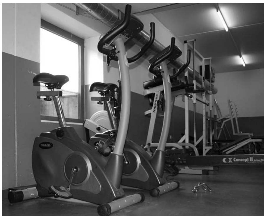
I hjertet af bygning 45.1 ligger et fitnesscenter, med alt hvad sjælen kan begære af træningsudstyr og muligheder for at opbygge kroppen i sundhedens tjeneste.