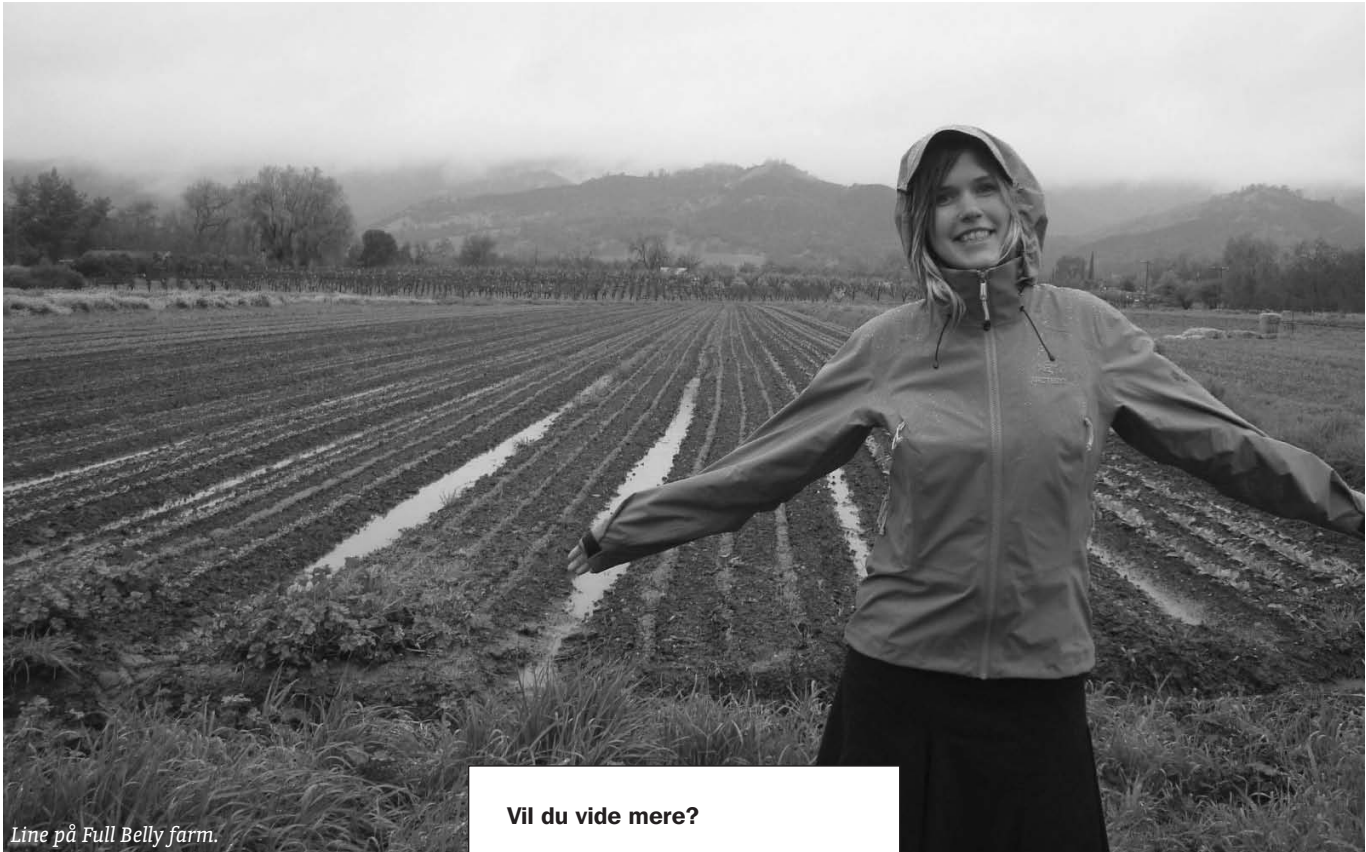
Line på Full Belly farm.