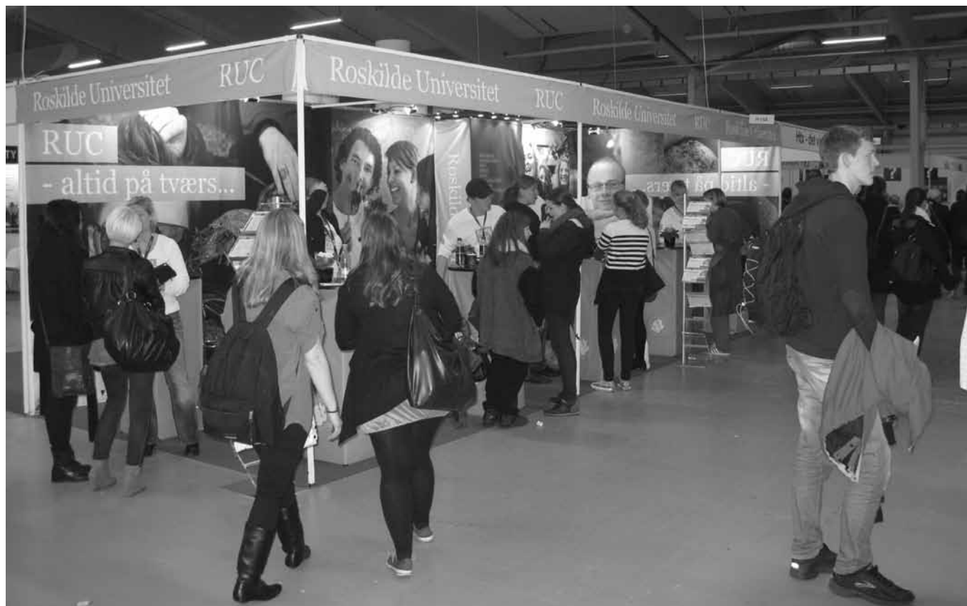
RUC's udstilling blev flittigt besøgt under messens to dage i Bella Center.