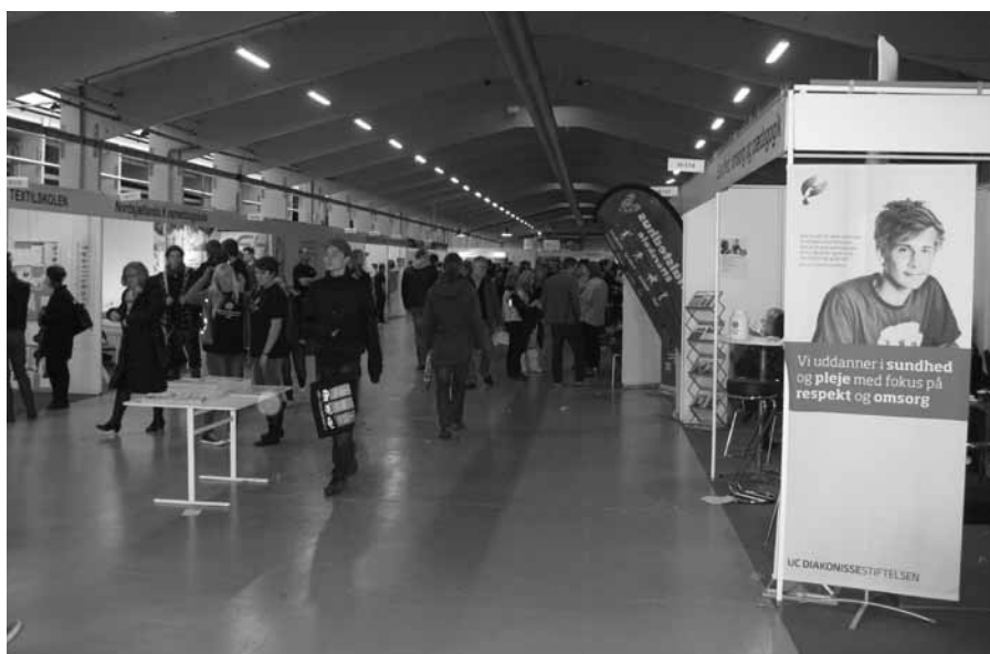
Bella Center summede af liv, da de unge skulle gøres bekendt med fremtidige uddannelsesmuligheder

»Folk spørger primært om tre forskellige ting: Hvad er RUC? Hvad kan jeg bruge RUC til? Hvad kan jeg bruge et specifikt fag til? Så enten ved folk allerede noget i forvejen, vi så kan tage udgangspunkt i, eller også starter vi helt fra