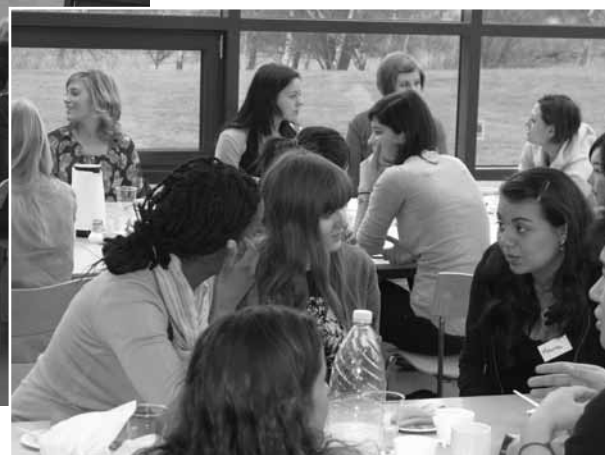
Der blev snakket ivrigt, da de internationale studerende havde deres første dag på RUC.