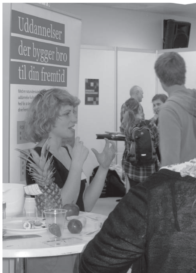
Det var muligt at deltage i forskellige quizzer til RUCs Åbent Hus den 1. marts.

Jeg har fået større forståelse for selve uddannelsesstrukturen. Men stedet og den sociale del af at gå på RUC kendte jeg til. Jeg har været til forelæsninger med en af mine veninder og har egentlig følt, at man hurtigt kunne finde nogle mennesker herude, som man godt kunne identificere sig med.