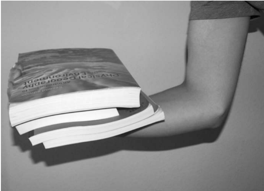
Er det et stykke elektriskerrør? Er det en albino stålorm? Nej, det er såmænd skriverkarlens vintertrætte overarme, der viser, hvordan man udnytter tung litteratur.