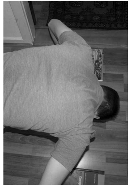
Sport og videnskab kan sagtens gå hånd i hånd (eller armbøjning). Skriverkarlen måtte selv lade musklerne tale, for at bringe jer listen til denne udgave af "Tredje Halvleg"