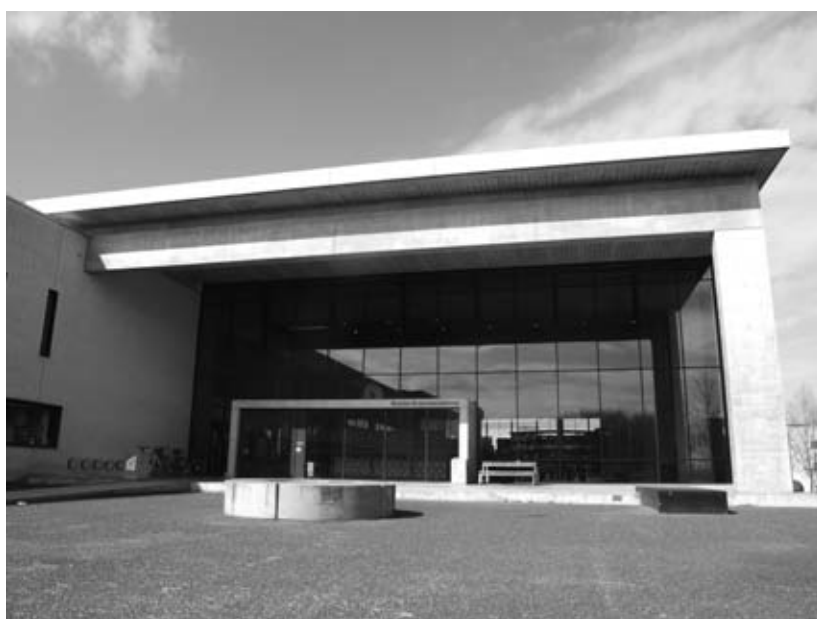
Pennen er stærkere end sværdet. Og langt mere praktisk når der skal skrives projekter og artikler...

Første offer bliver en hyggelig bekendt af alle indbyggere på campus, men samtidig en, som de fleste nok aldrig har taget sig tiden til at kigge ordentligt efter i sømmene. En højborg for skøn semantik, og et sted hvor de fortabte stemmer fra RUCs fortid er sikkert stuvet sammen i kælderetagen. Klar til opslag hvis nogen skulle lyste. Det er naturligvis biblioteket, det drejer sig om. For hvordan tager den gamle dame sig egentlig ud i al sin glans, og hvordan kunne vi eventuelt live hendes bogfyldte skørter en anelse op, så også de unge mennesker skulle få lyst til at træde op til dans? Frygt ej, blæk-kuliens skarpe øjne ser alt, og giver dig sandheden – uden omsvøb.