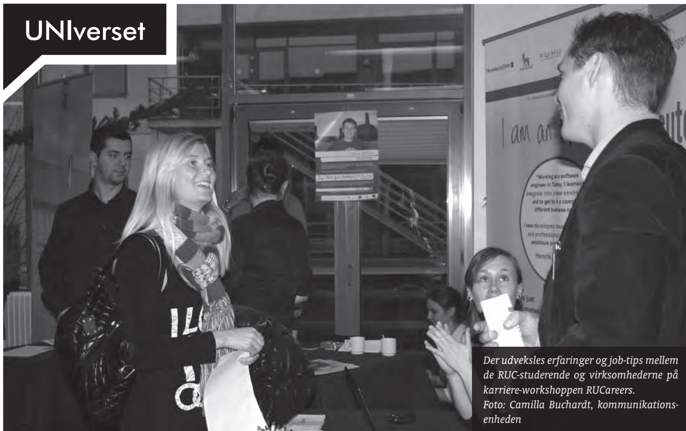
Der udveksles erfaringer og job-tips mellem de RUC-studerende og virksomhederne på karriere-workshoppen RUCareers.