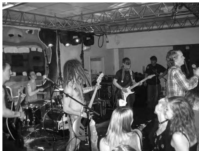
Årets vinderband, Angular Momentum