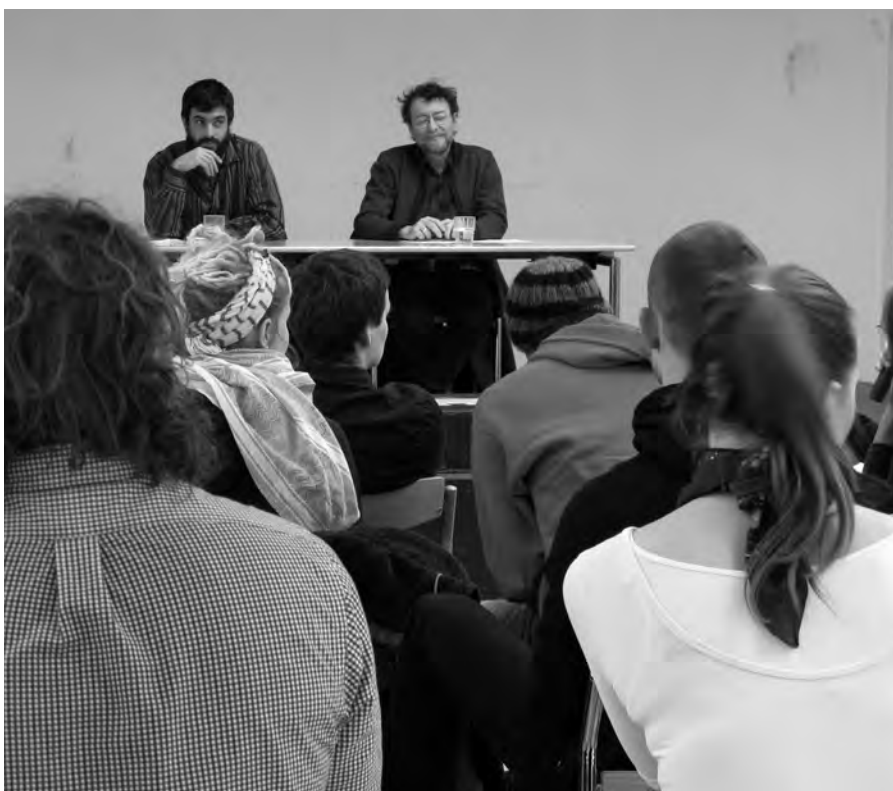
▶ De fremmødte i kantinen lytter interesseret.