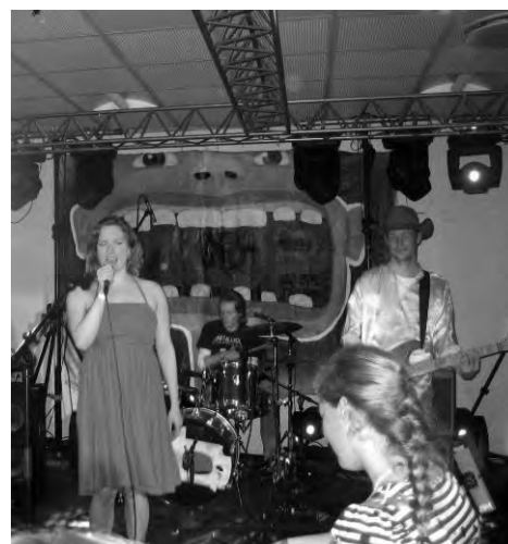
▶ Røde Kijafa