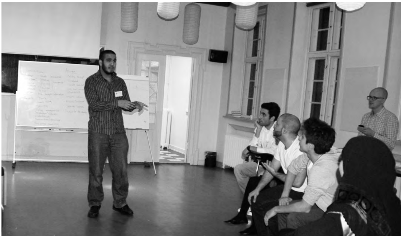
▲ ◀ ▲ Stemningsbilleder fra opstarskonferencen for Ny-Dansk Ungdomsråd.