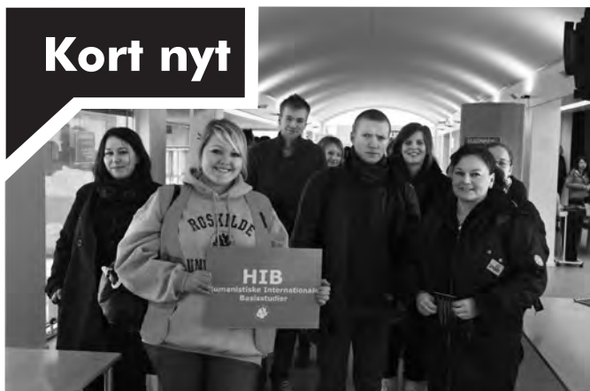
RUC-interesserede med en 'HIB'-guide