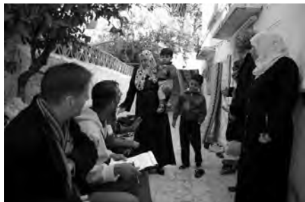
De unge frivillige snakker med de lokale jordanere om deres behov.