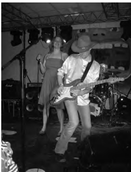
Gang i den

Da hvert band i klassisk melodi grand prix-stil kun har et enkelt nummer at optræde med, er der hurtig udskiftning på scenen. Næste band leverer afslappet, 70'er-inspireret, groovy disco-pop/rock med en behagelig laid back-attitude. Sangen, ja, den handler om kirsebærvin, og vi bliver indviet med en fællesskål i selvsamme drik. Eller, der er nok i grunden kun kirsebærvin på scenen, men folk bakker alligevel godt op om hyldestsangen til den ellers så hadede drik, og nummeret bliver afsluttet på samme vis, som det blev startet: