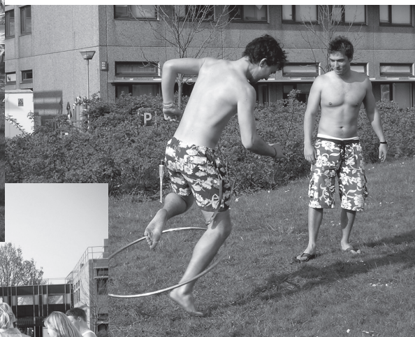
"I am still so amazed at how you are doing"