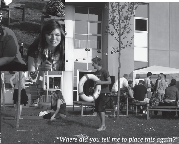
"Where did you tell me to place this again?"