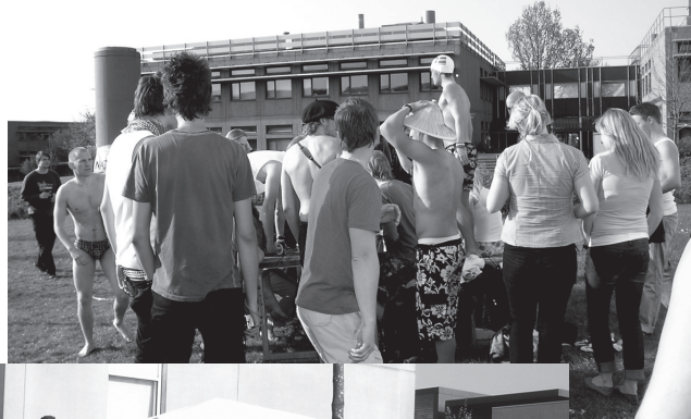
"Go, go, go, go!" Behind the crowd a beer competition is taking place.