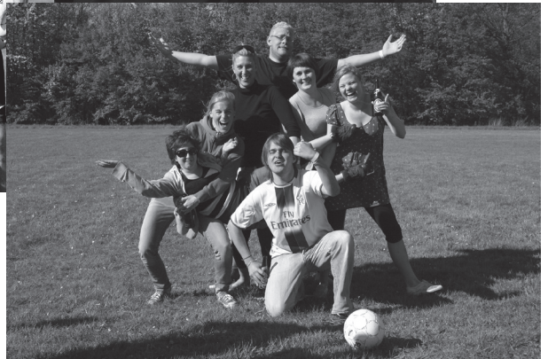
Taberne fra The Homeless Hobbits i Beverly Hills-inspireret opstilling.