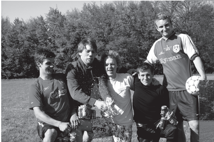
Vinderholdet Sevastis Boys fejrer sejren med rystede øl.