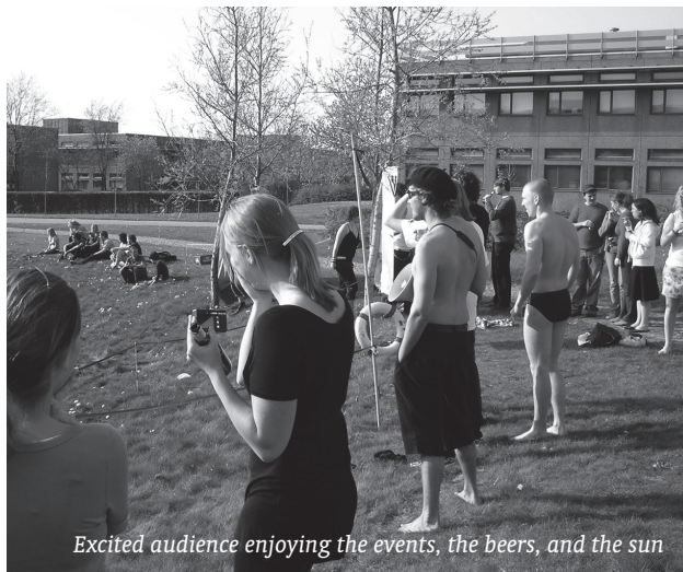
Excited audience enjoying the events, the beers, and the sun

On a Friday afternoon excited students gathered for the ØI-Olympics by the library pond. The whole event had been planned by NAT-students. Enjoy the pictures of the great festivities!