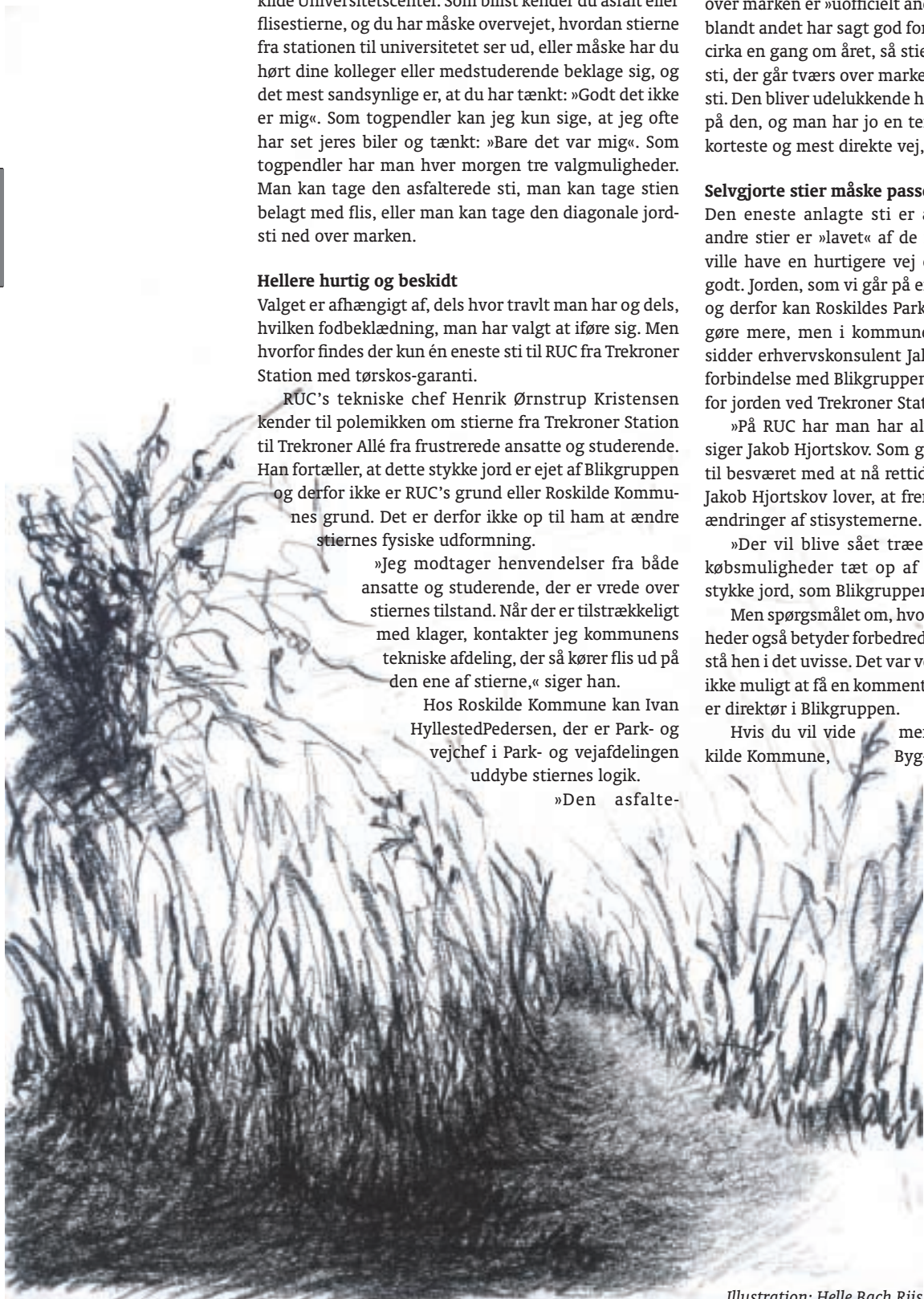
Illustration: Helle Bach Riis

Er en overordnet betegnelse for entreprenør- og ingeniørvirksomheden Bygnings-snedkernes A/S og tømrer- og snedkervirksomheden Snedkersvendenes A/S. Blikgruppen beskæftiger i alt ca. 200 mennesker.