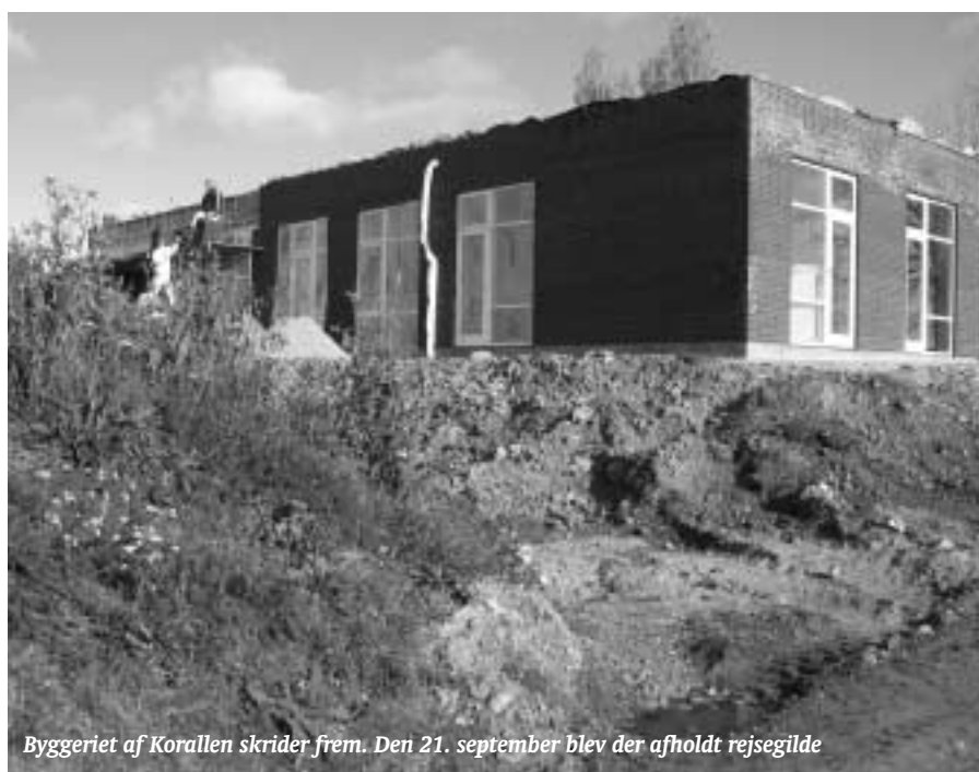
Byggeriet af Korallen skrider frem. Den 21. september blev der afholdt rejsegilde

Det kan gøre ventelisten svær at gennemskue for både forældre og pædagoger, men at man optager helt små børn på ventelisten, giver