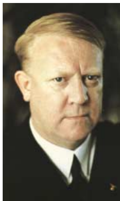
Vidkun Quisling: Også han benyttede en ekstern magtovertagelse til at »repræsentere« det folkelige bagland imod flertallets ønsker. Heller ikke han ønskede sit mandat afprøvet ved et demokratisk valg.

Det er muligt at LBF og LF endnu ikke er klar til at stole på elektronisk arkivering, men det er faktisk muligt at bevare dokumenter på en PC, selvom ”opsætning, styresystemer og indhold er ændret” i hvert fald er dokumenterne på SR’s servere kopieret hver gang systemet er opdateret (Det kunne de to herrer jo have spurgt web-masteren om) Når dertil kommer at referatet og bilagets ægthed er bevidnet af referenten selv og adskillige af de tilstedeværende på mødet (og ikke bestridt af nogen mødedeltager), så kunne man måske