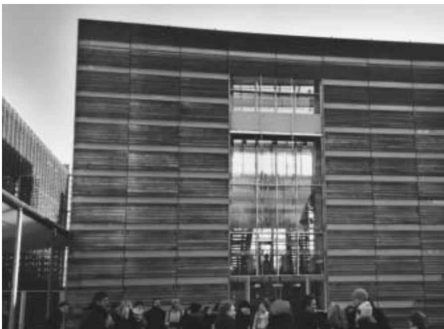
Den danske ambassade