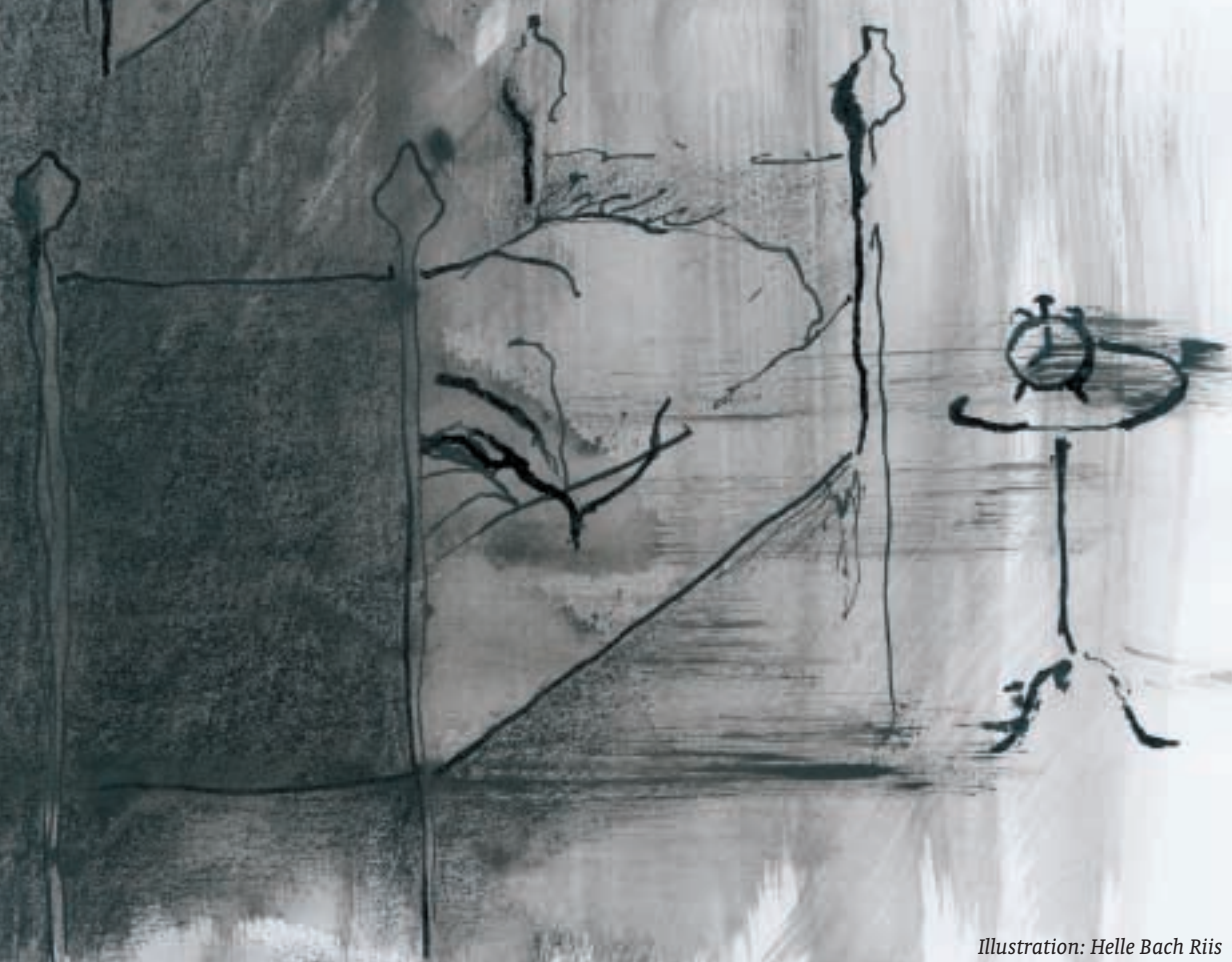
Illustration: Helle Bach Riis