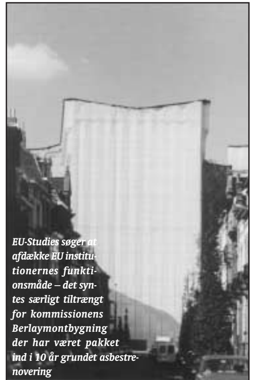
EU-Studies søger at afdække EU institutionernes funktionsmåde – det synes særligt tiltrængt for kommissionens Berlaymontbygning der har været pakket ind i 10 år grundet asbestre-novering

I det andet semester skal de studerende skrive et projekt med inddragelse af to kurser.