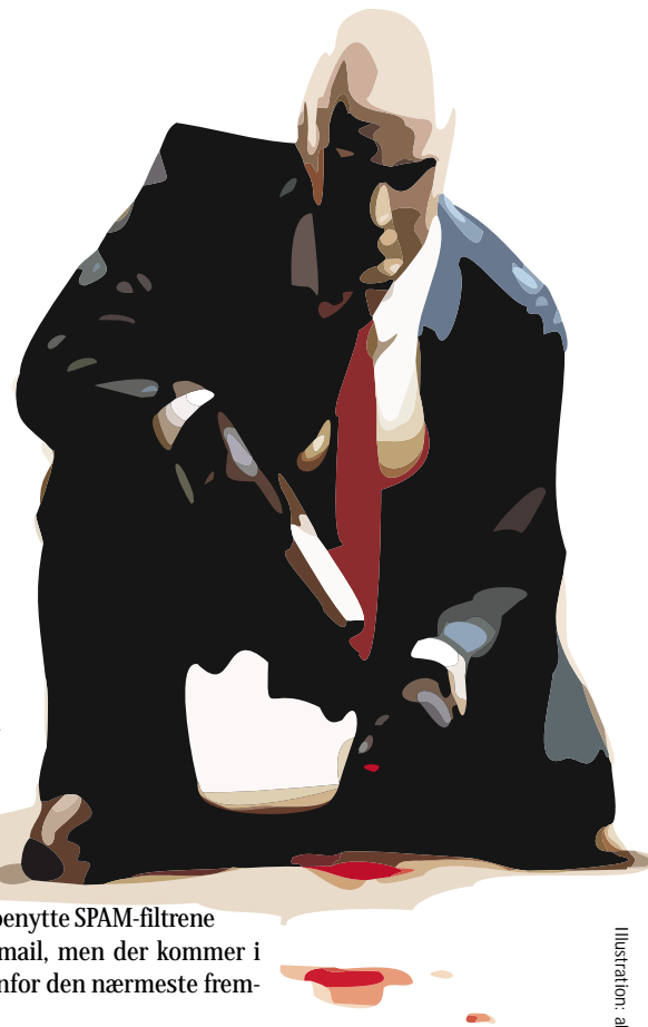
Illustration: dav frit efter 10Interactive

Kigger man på statistikken, er det mellem 15-20% af alle indgående breve, på RUC, der mærkes med 5 stjerner, dvs. som værende SPAM i vores nuværende konfiguration. Noget kunne tyde på, at de 5 stjerner er for lidt, hvis almindelige breve ikke også skal fanges af filteret. Til gengæld må man så leve med, at noget SPAM ikke bliver sorteret fra. Det firma, der har udviklet SpamAssassin, anbefaler sine internet-udbydere først at klassificere breve som SPAM, når der er 7 – 9 stjerner