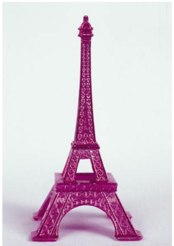
Illustration 2: Pink Eifeltårn

Min tiltrækning til det kitschede blev allerede etableret i 1980'erne, hvor jeg var stærkt påvirket af tiårets retrobølge og dyrkelse af kitsch-traditionen fra 1960'erne, i forbindelse med mine studier i kunsthistorie ved Department of Fine Arts på Washington State University i USA. Det