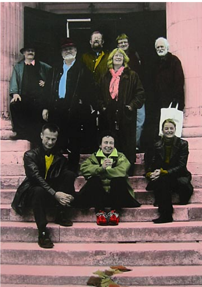
Forskergruppen foran det geologiske museum i Paris søndag den 17. november 2002.