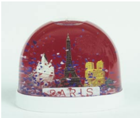
Illustration 1: Snekugle

Denne artikel indvier læseren i, hvorledes mit møde med souveniren i Paris satte nogle refleksioner i gang omkring smag og kitsch, og hvorledes det inspirerede mig til at udarbejde en serie håndkolorerede fotografier af Paris' seværdigheder, som i deres udformning er inspireret af souveniren. Med udgangspunkt i camp , som var en smagsdiskurs, der florerede i 60'erne, vil der blive reflekteret over det æstetisk udtryk, som ligger i tidens smag for kitsch og camp.