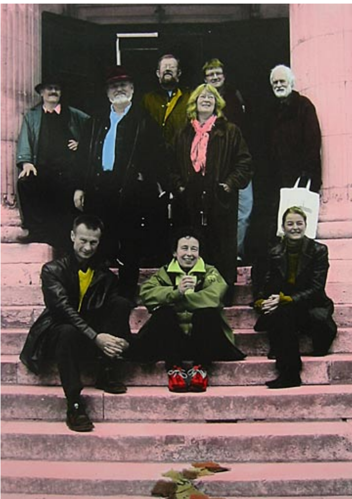
Forskergruppen foran det geologiske museum i Paris søndag den 17. november 2002.