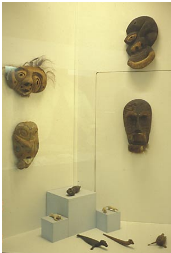
Fremvisning af dekontekstualiserede genstande.