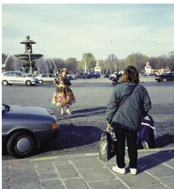
To be or not to be - is the question

Dansen om andethed, dels som racial andethed, dels som betydningens andethed, smelter sammen i Barthes ord. De vrider sig om hinanden, tæt forbundne, og det er svært at se, hvad der er hvad. Er den anden en myte? Frantz Fanon ville på det bestemteste mene det. For hvem er den første? Det afhænger jo helt af, hvorfra man ser. Når vi møder fremmede, opfatter vi dem som de andre, mens de på deres side opfatter os som de fremmede. Hvem er den anden, den fremmede? Magten til at definere sig selv som subjekt og som det væsentligste er afgørende.